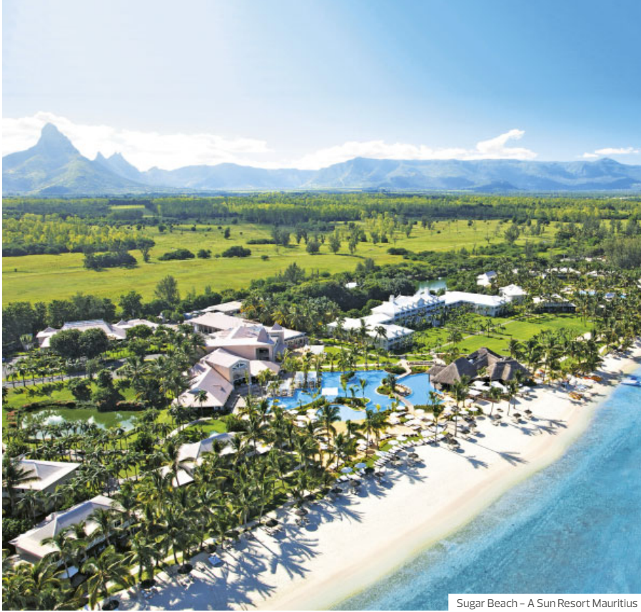
Sugar Beach – A Sun Resort Mauritius