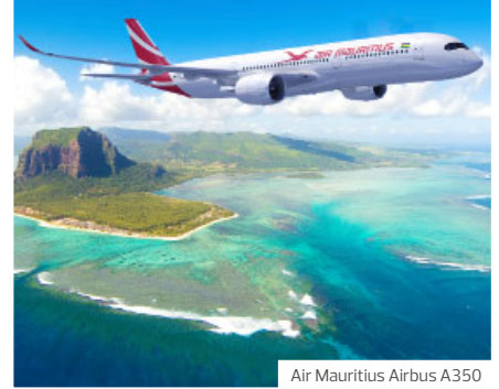
Air Mauritius Airbus A350