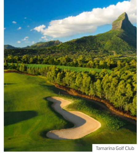
Tamarina Golf Club